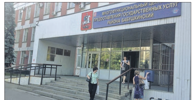
Многофункциональный центр в Бабушкинском районе

В округе организована работа 13 ярмарок выходного дня. С 27 августа 2014 года дополнительно открылись 4 региональные ярмарки, в сентябре появится ещё 3.