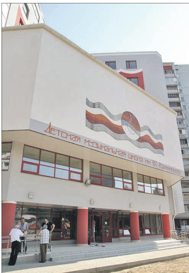
Новое здание детской музыкальной школы им. В.С.Калинникова (улица Абрамцевская, владение 8-10)