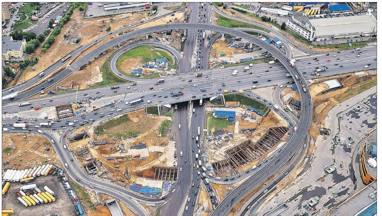
На Дмитровском шоссе построили новую эстакаду и съезд на внутреннюю сторону МКАД

Ведётся разработка проектно-сметной документации по 10 территориям, прилегающим к станциям метрополитена, расположенным на территории округа, с целью выполнения работ в 2015 году.