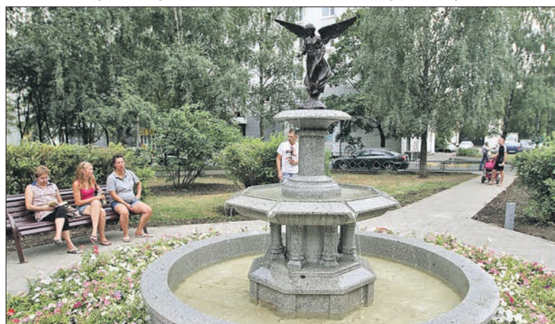
Благоустроенная территория двора на улице Череповецкой, 24