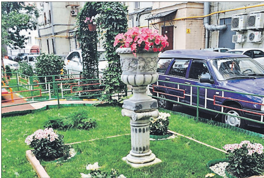
Двор на Сущёвском Валу, 3/5, победил в номинации «Лучший двор, сделанный своими руками» на городском конкурсе

Двор на Сущёвском Валу, 3/5, признан победителем в номинации «Лучший двор, сделанный своими руками».