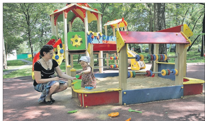
Отремонтированная детская площадка на улице Череповецкой, 7