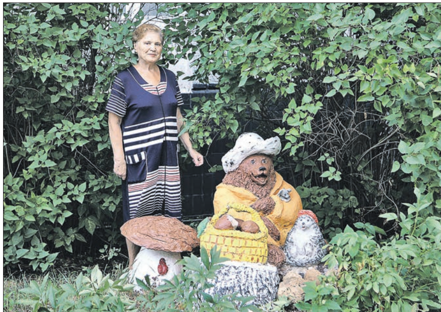
Жители дома 23, корпус 3, на улице Яблочкова украсили свой двор сказочными персонажами