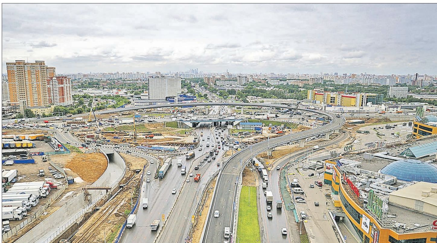
Новая эстакада на пересечении Дмитровского шоссе и МКАД

Сделаны дополнительные парковочные карманы на ул. Псковской, 7, корп. 1; Абрамцевской, 11, корп. 3, и на Новгородской, 38.